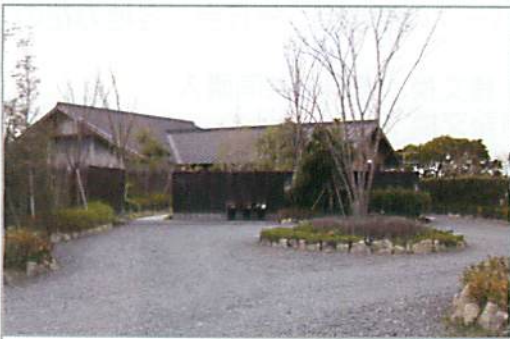
海のしょうげつ玄関口