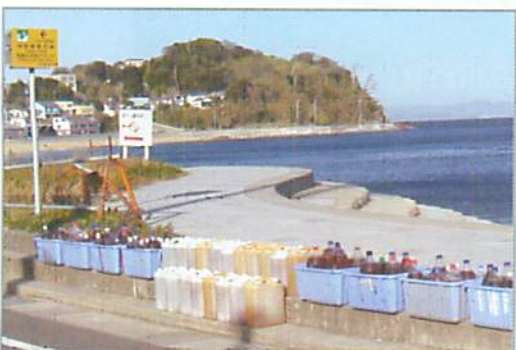
海岸に並んだペットボトル。島民 500 軒の各家庭が自主的に使用しています。