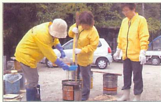
廃油を再利用して石けんづくりも行っています。