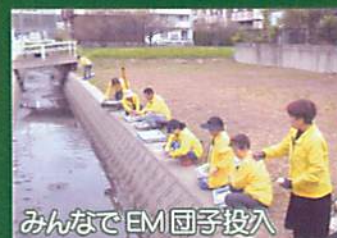
みんなでEM団子投入