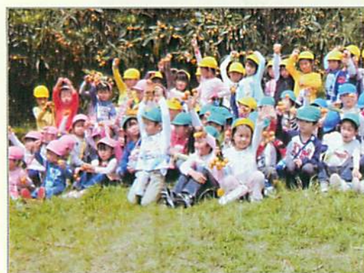
ピクニックに大喜びの幼稚園児たち

子育て支援センターで毎年 400～600 個の EM 団子と 40 トンの EM 活性液をつくり、河川に投入しています。下水道設備のない南知多町ですが、河川はととてもキレイです。また、毎年、豊浜小学校 5 年生に田植えと稲刈り体験を実施し、1 月にはもちつき大会も行っています。メダカやフナなどが棲む環境をつくるために、活動をより充実させ、行政や学校との連携をより図っていきます。