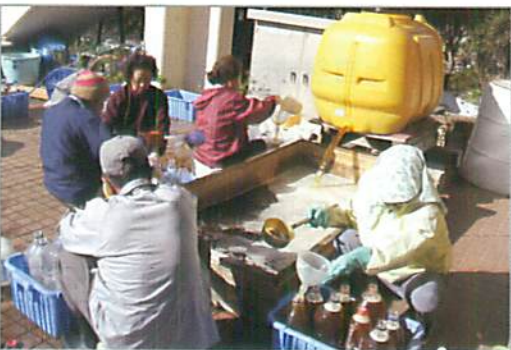
EM 活性液をボランティアでボトリング