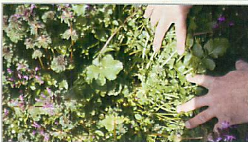
光輪畑では、雑草は地温・水分保持の役割を持ち、有機物として畑に有効活用されます。